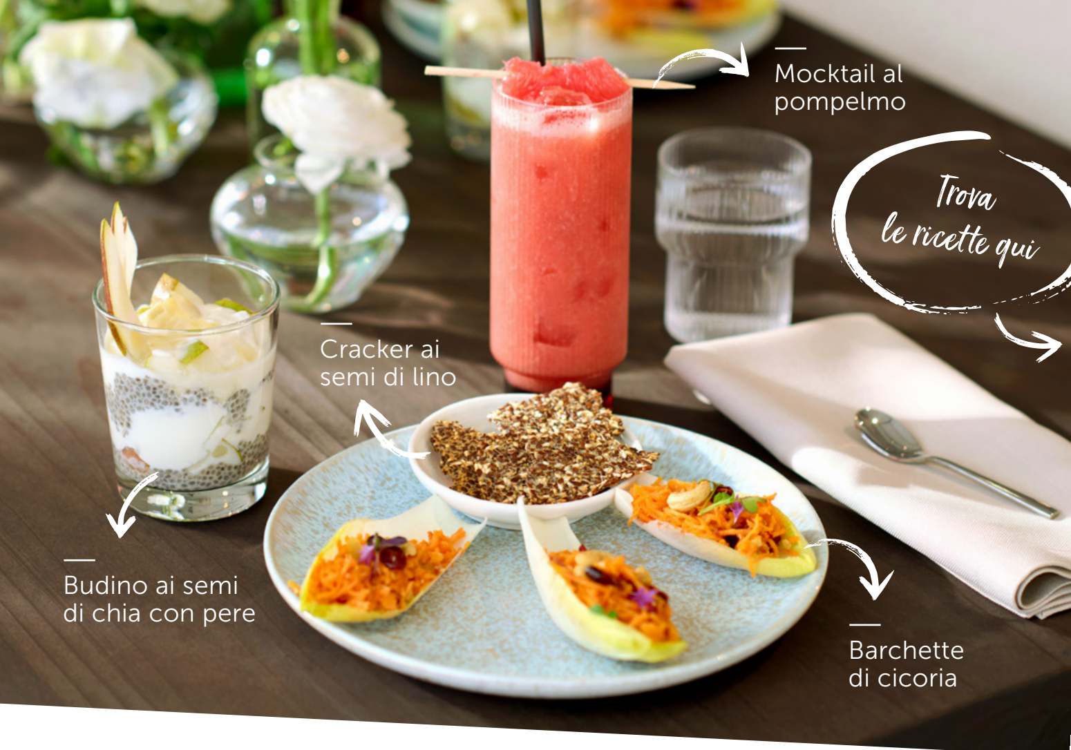
Mocktail al pompelmo